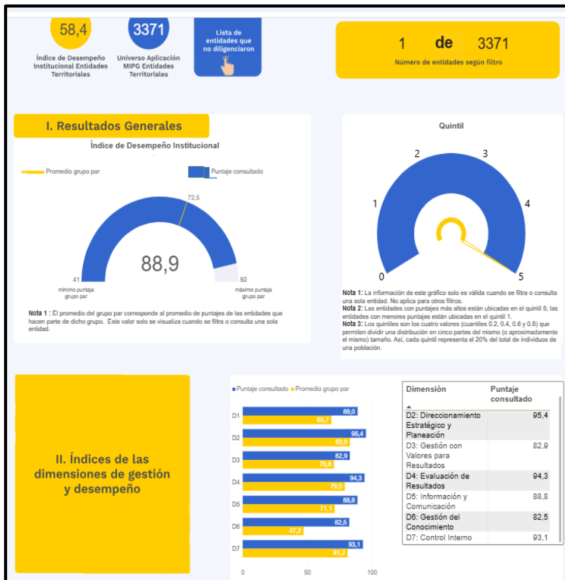
Imagen 2. Resultados obtenidos para la vigencia 2024. Fuente: Tomado de la página Web de la función pública.

https://app.powerbi.com/view?r=eyJrIjojOWY3ODMyOTAtYTMzMj00MjhjLWFiNmEtMGMzZDE4ZmY5NzMwliwidCI6IjU1MDNhYWMyLTdhMTUtNDZhZi1iNTIwLTJhNjc1YWQxZGZyXzNlImMiOjR9